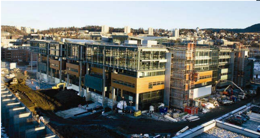
Nydalen Campus – mars 2005